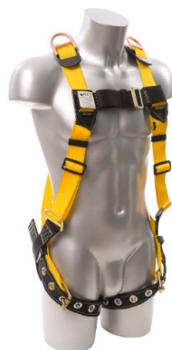
Tableau des tailles

Au moins tous les 12 mois, une personne compétente autre que l'utilisateur doit inspecter le harnais.