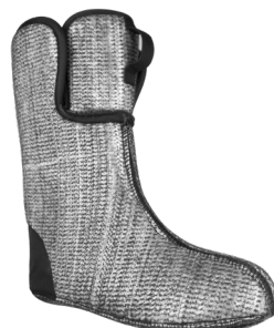
CHAUSSON AMOVIBLE (S22080 B11) INCLUS AVEC LA BOTTE.