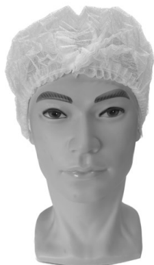
Tableau des tailles