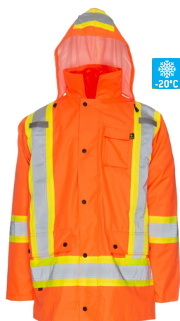
VMK775 Manteau 5 en 1