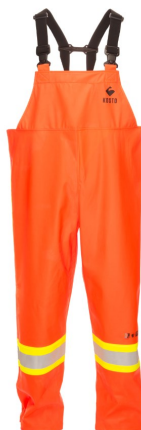
VHKF50 Habit de pluie FR