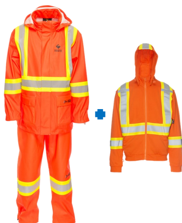
VMKF60 + VGKF65

Manteau de pluie et veste Arc flash (Cat. 2) ATPV 24 cal/cm 2